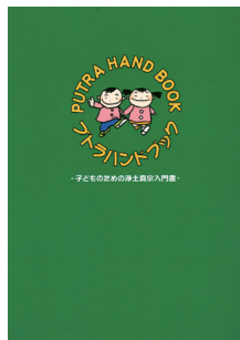
「プトラハンドブック」 調製