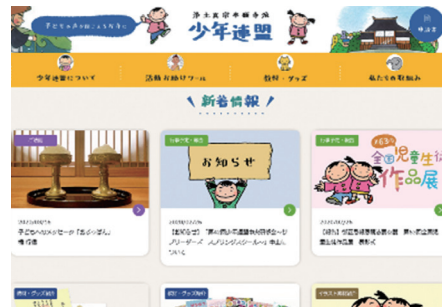
「少年連盟ホームページ」 リニューアル